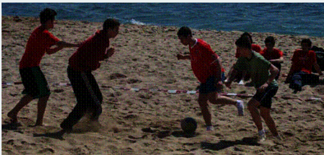
Els participants gaudeixen de l'esport en un marc idoni en molts aspectes

d'esports de platja hi van participar un total de 22 equips de volei, el que representa uns 120 nois i noies, i 14 equips de futbol, aproximadament uns 100 nois i