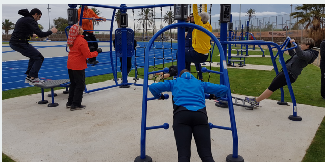
Esportistes de Barcelona, preparats per combatre el fred a La Mar Bella?

dable a través d'un treball cardio-vascular evitant l'impacte d'articulacions. Dilluns i dimecres de 18.00 a 19.00 h. i dissabtes, cada