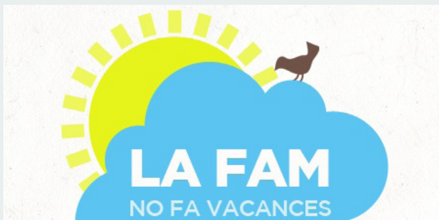
Aquest estiu, es combat la fam dels més vulnerables!

de conservació de llarga durada, permetran que centenars de famílies disposin d'aliments durant l'estiu.